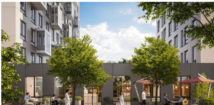
ЖК «Космопарк» УБ 3.2 Площадь 1/4 Этаж 1

«Космопарк»: • Удобный доступ и комфортная зона обслуживания на 1 этаже. • Витражное остекление наполняет помещение естественным светом и создаёт привлекательный внешний вид. • Все необходимые коммуникации подключены и готовы к использованию. • Развитая инфраструктура района с транспортной доступностью, парковками • Безопасная и ухоженная территория комплекса с круглосуточной охраной и видеонаблюдением. DOGMA — федеральный девелопер, входящий в ТОП-3 крупнейших застройщиков России по объёму строительства. С 2011 года компания реализовала проекты общей площадью более 1,9 млн м 2 , более 98 домов сдано точно в срок и более 23 000 семей живут в уже построенных кварталах. Мы не просто строим дома — мы создаём наследие. Свяжитесь с нами, чтобы узнать подробности и забронировать помещение!