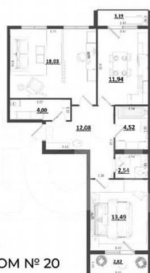
ДОМ № 20

2 КОЛ-ВО КОМНАТ 3 ЭТАЖ 72,61 м² ПЛОЩАДЬ 2 ПОДЪЕЗД